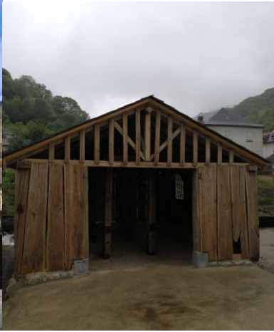
METIER A FERRER