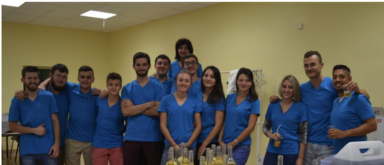
LES MEMBRES ET BENEVOLES DU COMITE DES FÊTES