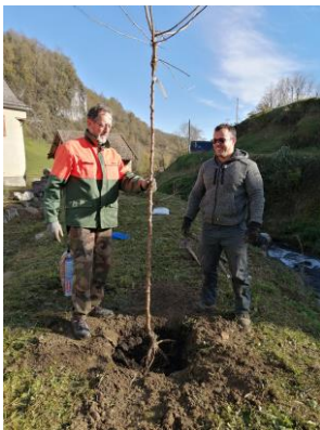
PLANTATIONS ARBRES A LA RIVIERE