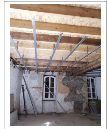
Réhabilitation appartement instituteur AVANT APRES